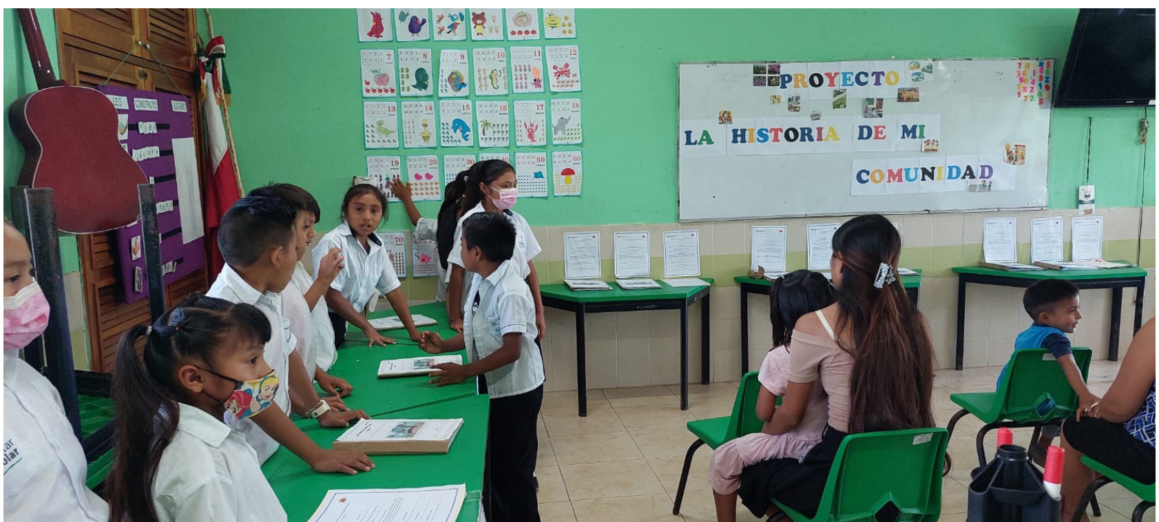
Habilitación de espacios escolares en abandono para fines pedagógicos de la Escuela Primaria Indígena "Rafael Ramírez Castañeda".

Flores, H. (2021). La gestión educativa, disciplina con características propias. La gestión educativa, disciplina con características propias. Dilemas contemporáneos: educación, política y valores , 9(1), 00008. Epub 3 de noviembre de 2021. https://doi.org/10.46377/dilemas.v9i1.2832 .