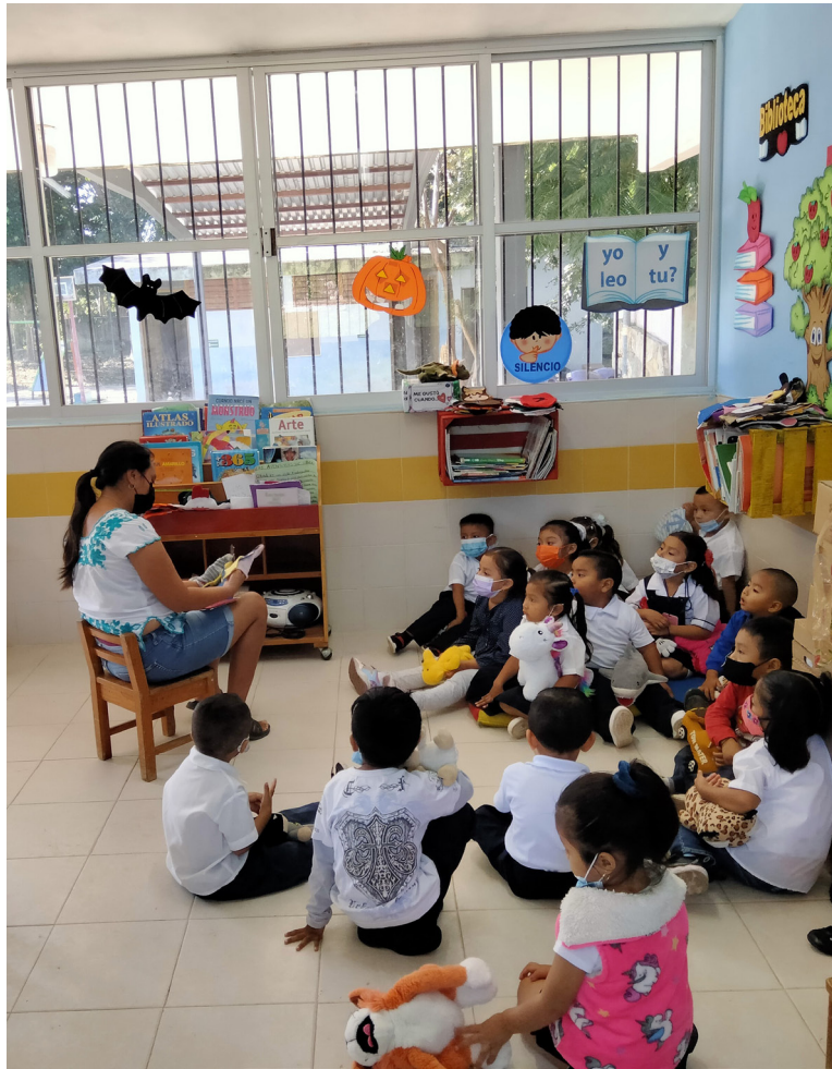
Rincón de lectura y calma "Mis amigos los libros" de la Escuela Preescolar Indígena "Augusto Alberto Cárdenas Pinelo" con C.C.T. 31DJN20550.

recursos, que generan procesos participativos en beneficio de la comunidad..." (p. 81).