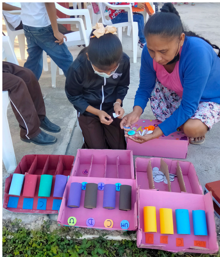
El Guía Pedagógico Multigrado (GPM) brinda apoyo a los docentes de escuelas multigrado para el diseño e implementación de materiales didácticos que fortalezcan la práctica docente.

Por otra parte, se ha demostrado que los dispositivos de formación fundados en el aprendizaje autónomo, horizontal y colaborativo resultan más efectivos para lograr el cambio de las prácticas de enseñanza, ya que permiten probar nuevas estrategias didácticas, contextualizarlas y analizar las dificultades que se presentan en los escenarios reales a medida que ocurren, buscando que el docente se involucre de manera voluntaria, sin necesidad de obligar o condicionar su participación en el proceso de intervención. Por consiguiente, el acompañamiento pedagógico in situ es una alternativa superadora de los modelos de formación permanente de carácter instrumental y carencia basada en cursos puntuales, masivos, homogéneos y en la transmisión unilateral (expertos y especialistas) de conocimientos, ya