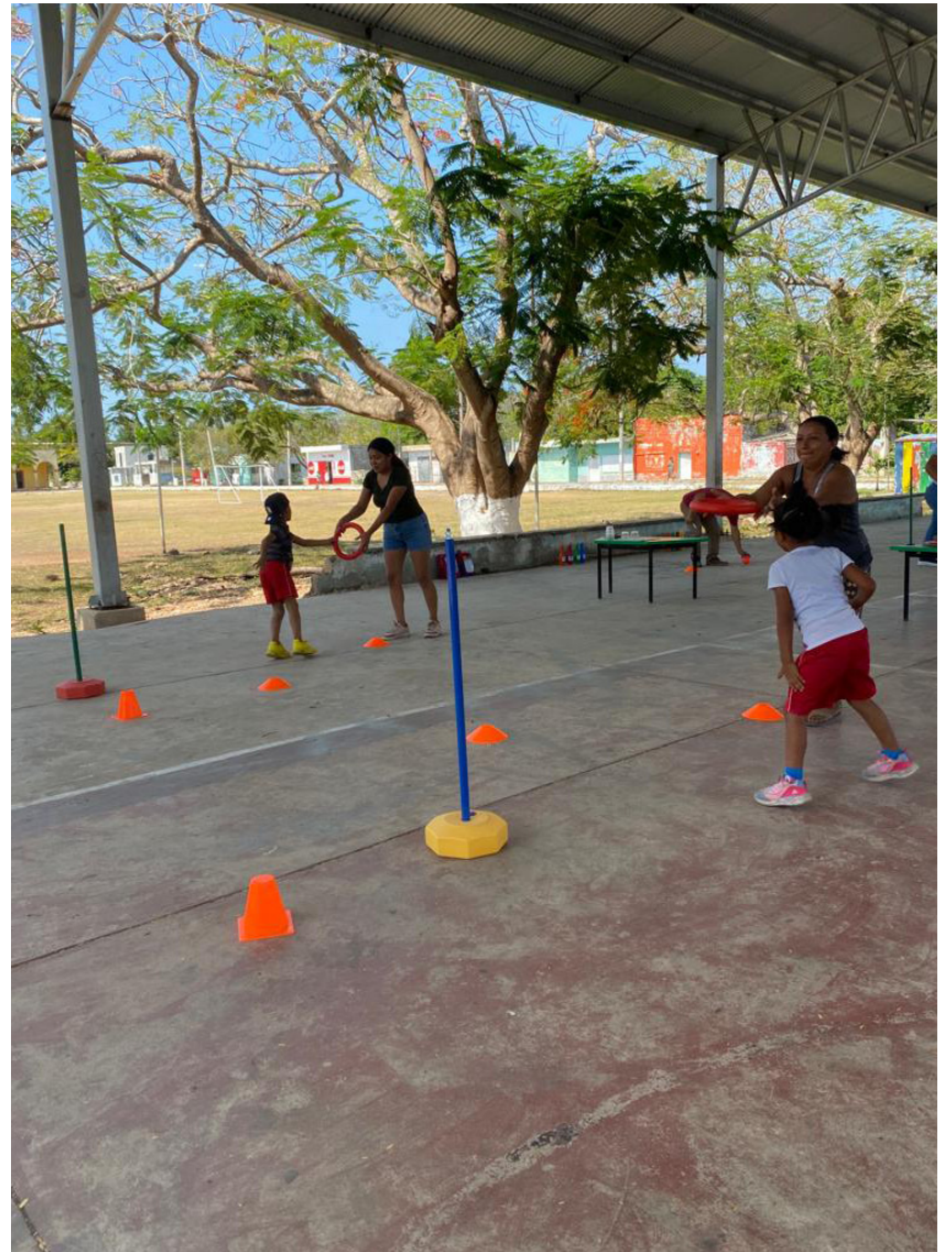
Implementación de la estrategia didáctica "Exatlón de las vocales" como parte del trabajo colaborativo entre el docente y el Guía Pedagógico Multigrado (GPM) durante el proceso de acompañamiento pedagógico del ciclo escolar 2023-2024.