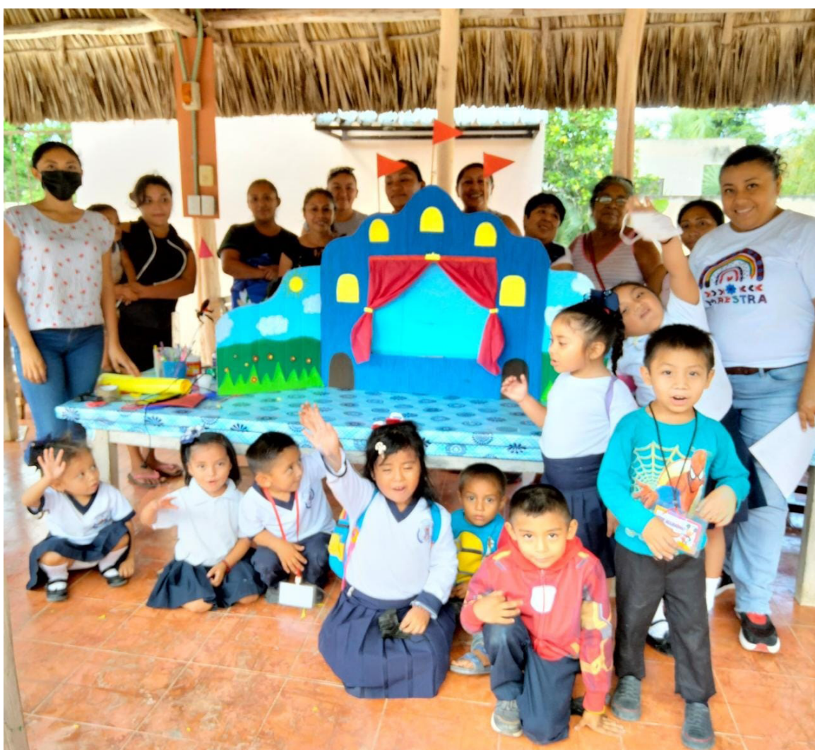
Alumnos y padres de familia intervienen en las actividades que realizan los GPM.

"Hacerle saber a mi hijo que es importante para mí y que compartir con él me hace sentir feliz" (SIC).