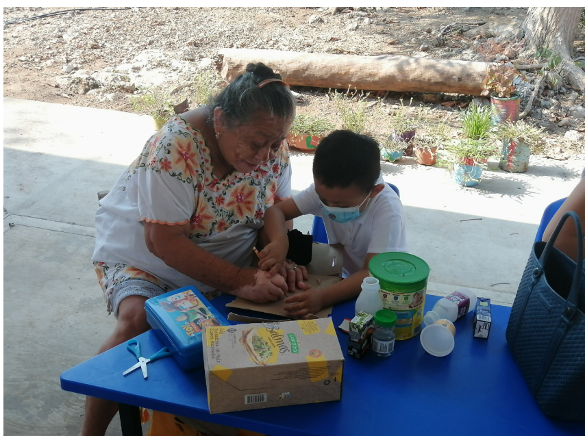
Fortalecer el involucramiento de los padres de familia en escuelas multigrado durante la implementación de las secuencias didácticas.

Uno de los principales aspectos abordados y fortalecidos fue el de la planeación didáctica, utilizando y aplicando