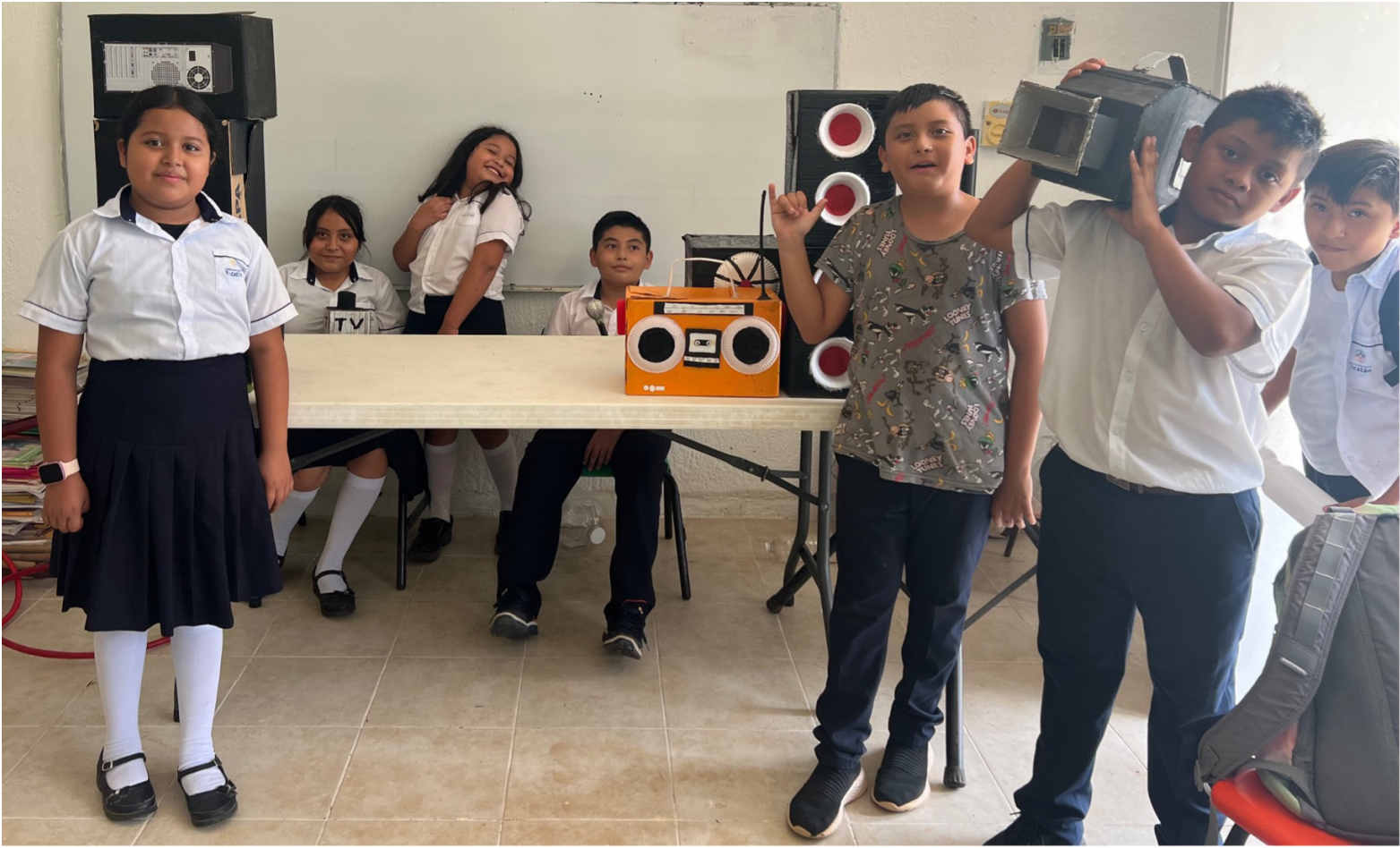
Material didáctico "LA RADIO" diseñado e implementado en la Esc. Prim. Ind. Julio De La Fuente con C.C.T. 31DPB0256P.