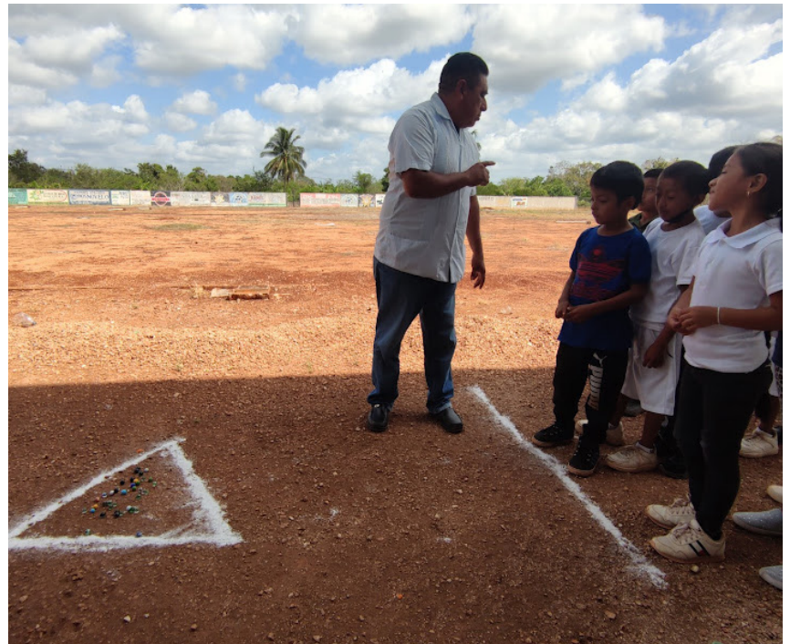
Implementación de metodología basada en proyecto para el fortalecimiento de los contenidos temáticos multigrado; la vinculación, la transversalidad, el tema en común, actividades diferenciadas, gradualidad, diseño de consignas y propósitos, como parte del trabajo colaborativo entre docente y Guía Pedagógico Multigrado (GPM).

rúbricas, el uso e implementación de metodologías por proyectos, entre otros aspectos. Si bien, esto se pudiera ver como un trabajo cotidiano y sin complicaciones, al tener otras responsabilidades aparte del grupo, a veces nos hace perder el enfoque y objetivo por el cual estamos en las escuelas, estar frente a grupo y a partir de ello, que los niños y niñas se desarrollen de manera integral.