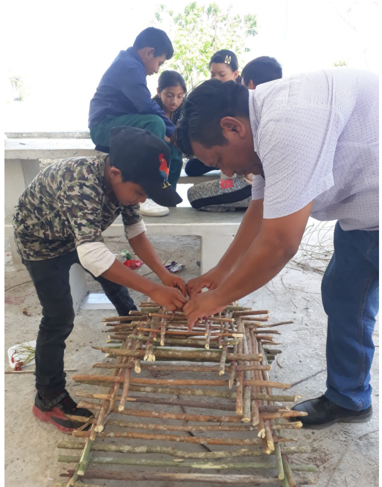
Utilización de los recursos naturales presentes en el entorno escolar, con la participación de los alumnos y la adquisición de competencias creativas.