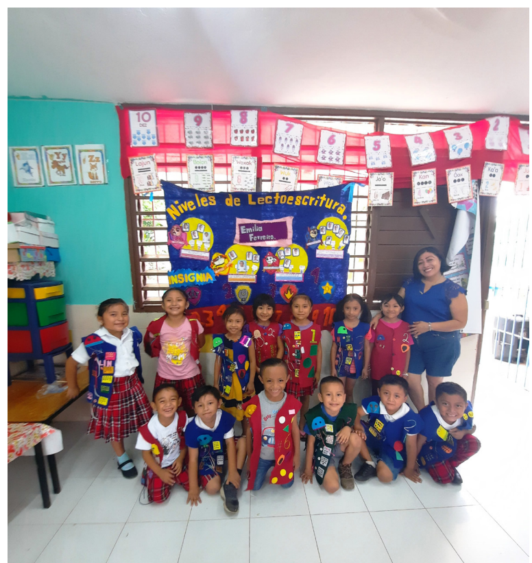
Alumnos de la Escuela Preescolar Indígena "Kukulcán", después de realizar la estrategia didáctica "Chaleco explorador".

"Sí es posible aplicar la gamificación sin recursos tecnológicos, ya que gamificar no implica tecnología necesariamente, sin embargo, sí requiere imaginación, innovación, creatividad y sobre todo vocación".