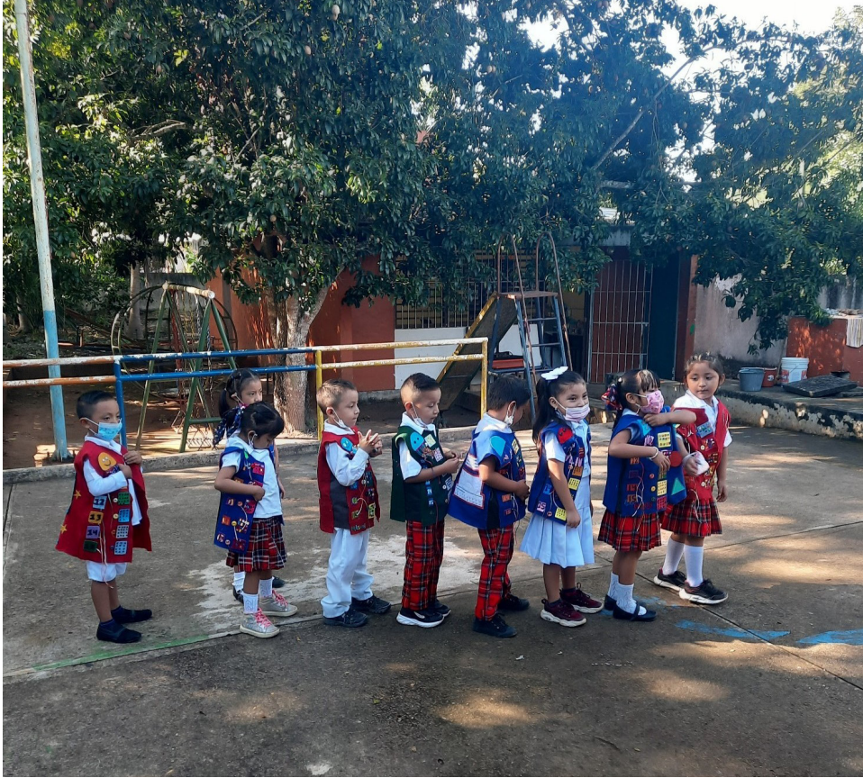
Implementación de la estrategia didáctica “Chaleco explorador” en la Esc. Preescolar Indígena “Kukulcán” con C.C.T. 31DCC0140K, como parte del ciclo de acompañamiento pedagógico 2023-2024.