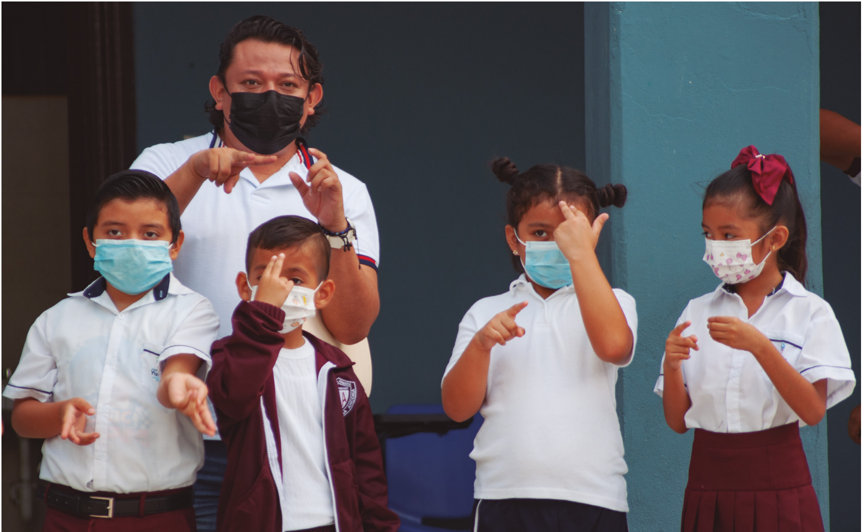
Seña: de recordar, recuerdo. Durante el homenaje a la bandera. en la Primaria "María Antonia Ancona". Junio 2022.

al personal de nuevo ingreso al servicio público educativo, bajo la responsabilidad del supervisor de zona escolar, a fin de brindar a los alumnos una educación de excelencia con equidad e inclusión.